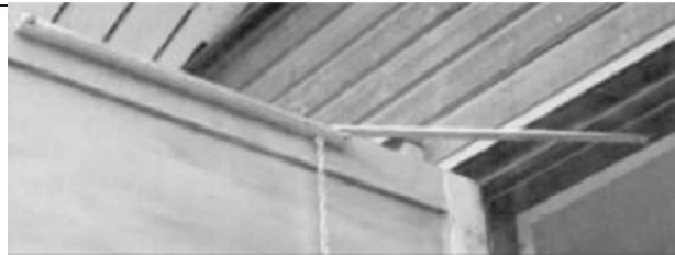
Tuulisalpa 001 asennettuna autotallin oveen