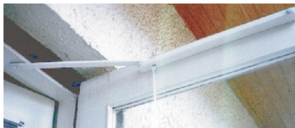
003 установлено на балконные двери

Технические характеристики и размеры -С-профиль 400x28x15мм, упорная планка 380x20x6мм. Подходит для правых и для левых дверей. В комплект входят шурупы. -Угол открывания дверей max. 110 градусов. Ширина Двери 600-900мм