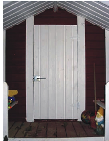
Säppisalpa 020 asennettuna leikkimökin oveen.